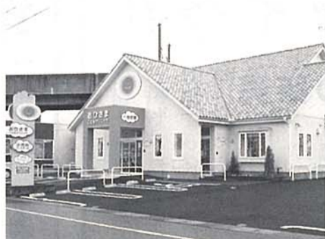
オレンジの屋根に黄色い外壁、大きな太陽のマークが目印

プライベートサロンのような心地よさ 整体&リラクゼーション包 10月10日、三条・小須戸線沿いにオープンした包。マンツーマンの施術のため、まるでプライベートサロンのような心地よさ。痛みや体の歪みが気になる方は「整体療法」、疲れやコリには「つぼ押しリラク」、美容には「包式リラク」と3タイプの施術が用意されている。施術後には、代謝を上げて美容・健康を促進する中国茶をサービス。通うたびに調子が良くなっていく体を実感できるはず。