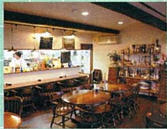
地元の契約農家から仕入れている有機野菜には、ちりめんキャベツやリーキなど珍しいものも多い。お酒はワインを中心に世界各国の銘酒がそろう

イタリアンレストラン&バー SPS 中央区神道寺南2-6-8 0255-1117 営業時間 11:30~14:30 18:00~22:30 定休日 日・月曜日 ※新年の営業は1/4から7台