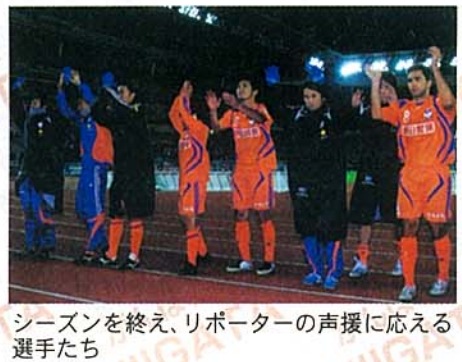
シーズンを終え、リポーターの声援に応える選手たち

いつもアルビレックス新潟に温かいご声援をいただき、誠にありがとうございます。 さて、J1・2007シーズンは12月1日の大分戦で全日程を終了し、わがアルビレックス新潟は15勝6分13敗、勝ち点51、得失点差+1の成績で6位という結果でした。シーズン当初に掲げた目標を達成し、J1昇格後、クラブ史上最高位でフィニッシュいたしました。これはチーム・監督・選手の活躍もさることながら、サポーターの皆さまの大きな声援が力となったことはいまでもありません。今シーズンも、昨シーズン戦ってきた選手に新たに加入するメンバーを加えて、人もボールも動くアグレッシブなサッカーを昇華させ、さらに高みを目指していきます。 アルビレックス新潟では、2008シーズンに選手たちが着用して戦う新ユニフォームを発表いたしました。コンセプトはさらに高みを目指すための「世界基準」。現在、新ユニフォームの予約販売受付を行っております。 2008シーズンも昨シーズン同様、満員のスタジアムで皆さまから熱いご声援を送っていただき、歓喜の瞬間を一緒に迎えましょう! 今シーズンも皆さまの熱いご応援、よろしくお願いたします。