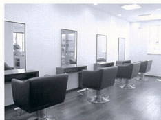
革のイスと木目の床のアーバンな空間。イスの間隔も広く取られ、ゆったりとした雰囲気

障がい者の自立を支援するパン屋さん SWAN CAFE & BAKERY 5月17日、障がい者支援し労働機会を提供するベイクアリー&カフェがオープン。店内で焼き上げるパンは50種類を超え、いつでも焼き立てが並ぶ。オーススは、水の代わり牛乳を使って作る牛乳食パン(1本760円・1斤380円)。自然な甘みとふんわりした食感で人気だ。併設のカフェでは、パンと一緒にオリジナルコーヒを楽しんだり、パスタやお酒も提供している。