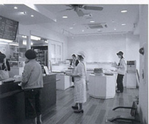
パンの焼き上がるいい匂いがあるふれる店内、奥にはカフェコーナーもあり、完全分煙の喫煙席も完備されている

中央区神道寺1-1-18 ①248-7777 ②7:00～22:00 ※ランチ11:00～13:30・デザート ※アフタヌーン17:00～21:30・ラストオーダー ③無休 ④15台 http://www.swanbakery.jp