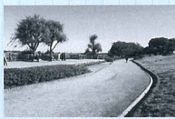
地域の自慢、鳥屋野湖公園は散策を楽しむ人々が行き交う

若い方の提案で、年一回親睦会を開いて、老若男女顔見知りになる有難義塾半日を過ごします。これから新市政の下、安心して暮らせる強固な自治会になりたいといひたいです。