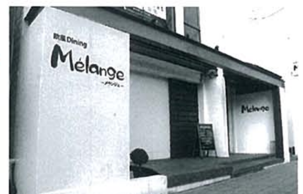
白壁と大きな木の扉が特徴。特別な時間を彩ってくれる料理・お酒を堪能してください

1月3日、けやき通りにオープンしたダイニングバー。新潟市内でそれぞれ活躍していたスタッフが集まり、本格イタリアンとフレンチ、そして本場ベルギービールやカクテルなどを提供します。23時までは料理メインのディナータイム、以降はバータイムと分かれていますので、2通りの楽しみ方ができます。