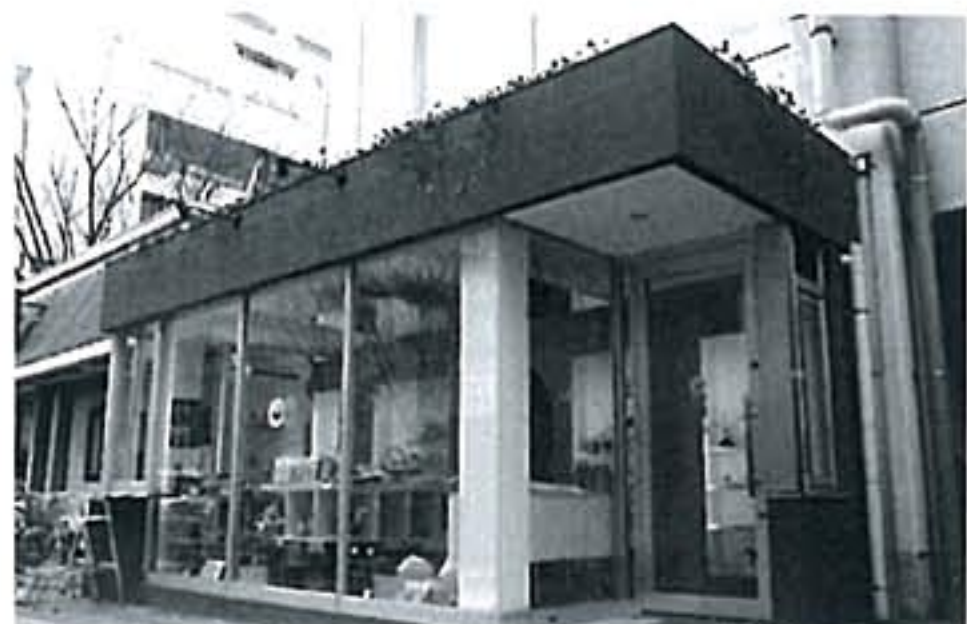
普段使いの野菜から世界一高価なみそなど、珍しい品が約300アイテムもそろっています

昨年11月22日、お宝市場クチコムが万代シティにオープン。店内には生産者の思いがこもった野菜や果物、県内各地で作られている希少な加工品など、新潟が誇る「お宝」が多数取り扱われています。おいしい食べ方や保存方法などもアドバイスしてくれるので、買い物の際にはぜひ聞いてみましょう!