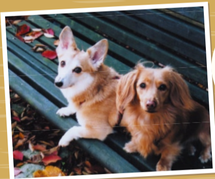
(左から) モモ(メス・9歳) ミル(メス・8歳)

モモ(百)とミル(千)の仲良し短足姉妹です。犬種が違うのに、親子?とよく聞かれます。