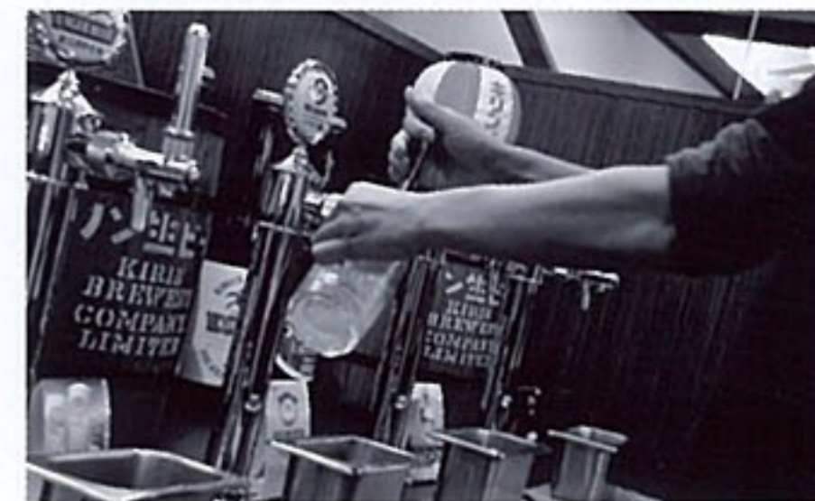
パーティープランは1人4,000円～。飲み放題(2時間)に料理8品が付いて、とってもお得!

11月1日、けやき通りにぜひ飲みたいビールとこだわりの料理を提供する店が誕生。1Fダイニングでは、8種類のプレミアムビールと鮮魚をはじめとした多彩なメニューを提供。2Fビアホールでは、5種類の生ビールがセルフサービスで楽しめます(飲み放題2時間2,500円)。年末のパーティーなどで大活躍しそうなお店です。