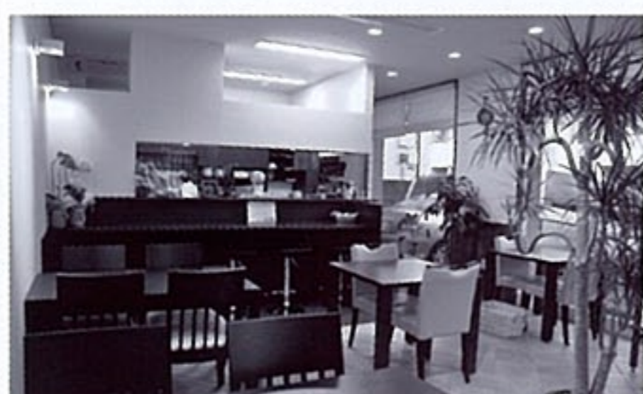
カフェのオススメは「ガンジーミルクの自家製アイス(480円)」。濃厚なのにサッパリとした後口です

10月12日、体に優しい食材を使ったランチを提供する店がオープン。野菜や玄米、豆類をふんだんに使ったメニューは、毎日でも食べたいくらいヘルシーで、栄養満点です。イチオシの和おんランチ(1,000円)は、五穀玄米豆ご飯にお惣菜3品、食べ応えのあるスープ、自家製デザートまで付いて大満足のメニュー。また、コーヒーや紅茶は自由に飲むことができます。