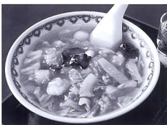
イカやエビ、ホタテなどの具材がたっぷり入った五目あんかけラーメン(730円)

髪と心の癒やし空間おもてなしサロン誕生 美容室 アフソット 古町で人気の美容室アフソットが2月6日、上近江の笹出線沿いに移転オープン。広々とした店内は、隣りが気にならないゆとり空間で、ネイル・ヘアエスプレッ・ヘッドスパ、それぞれ専用部屋があり、さらなる癒やしを求める人に最適な髪だけだけでなく、よりリラックスできるおもてなしのサロンで、日常を忘れた素敵な時間を過ごしてみたい。