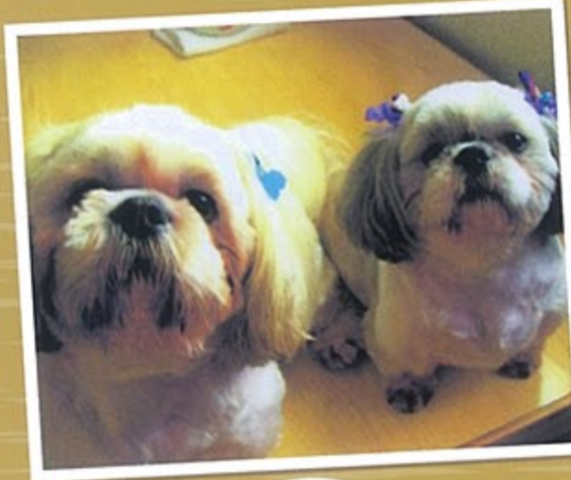
(左から)クッキー(オス・6才) チョコ(オス・6才)

仲よし兄弟で2匹はいつも一緒!クッキーは食いしん坊で、チョコは主人の頭をなめるのが好きです。