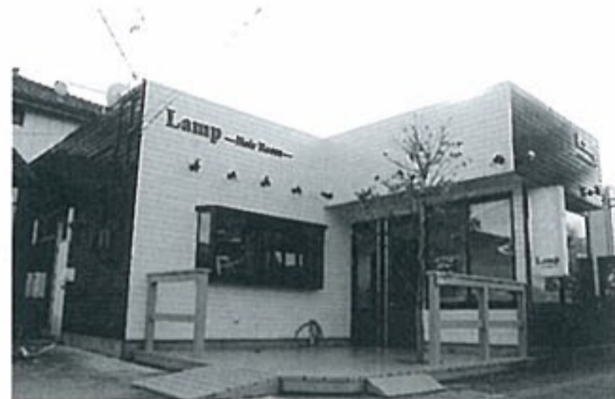
茶色と水色のコンビの外観が目印。店内もやさしい雰囲気です

11月3日にオープンした美容室・Lamp Hair Room。「幅広い年齢層のお客さまが、身構えることなく利用できる美容室」を目指し、ゆったりとした雰囲気とリーズナブルな価格を実現しています。クリスマスや飲み会などのイベントが多い12月、ヘアスタイルも一新して楽しく過ごしましょう!