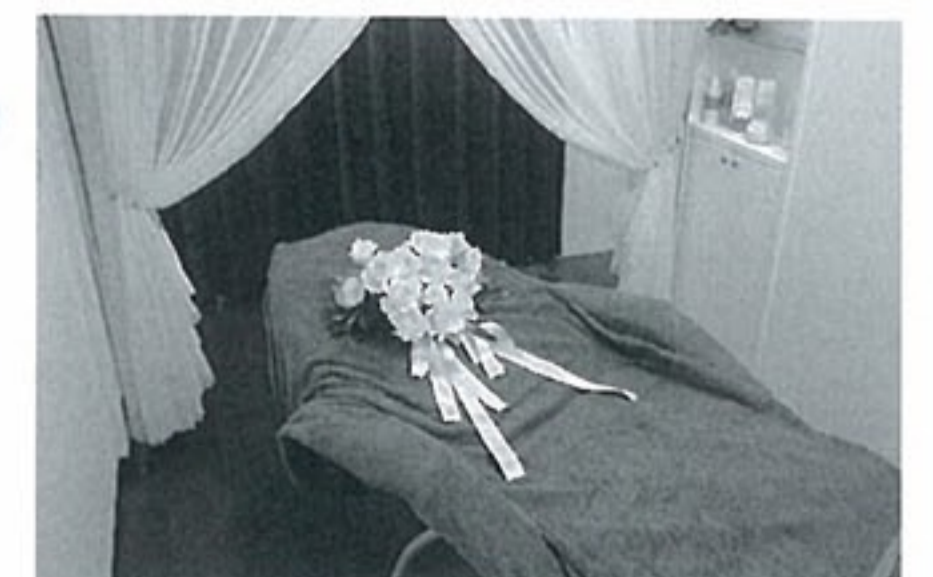
施術スペースは完全個室。静かな環境で癒やしの効果もバッチリ

10月20日、女性専用のお顔そり専門店がオープン。熟達した技術を持つ女性スタッフが丁寧に施術、お顔そりコース(2,415円)では酵素パックやトルマリンマスクなども用い、美顔エステの効果も得られます。ほかにないサービスがリーズナブルに楽しめるので、まずは気軽に訪れてみては。